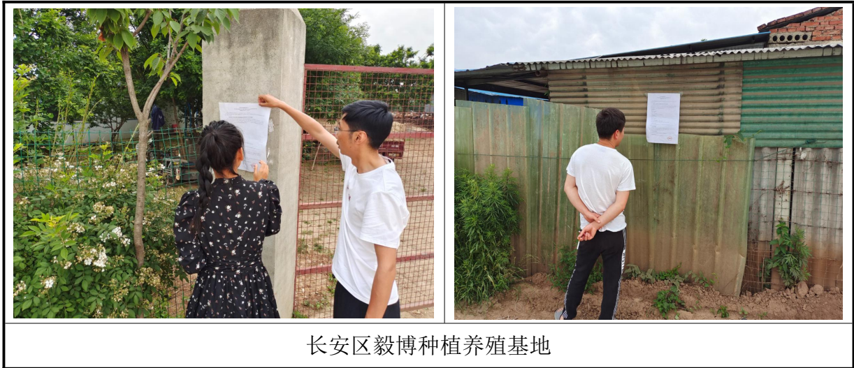
长安区毅博种植养殖基地